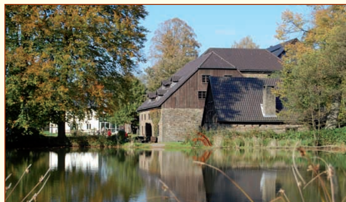
Ansicht der Hütte von Süden

1866 Der Hochofen wird ausgeblasen und die Anlage geschlossen.