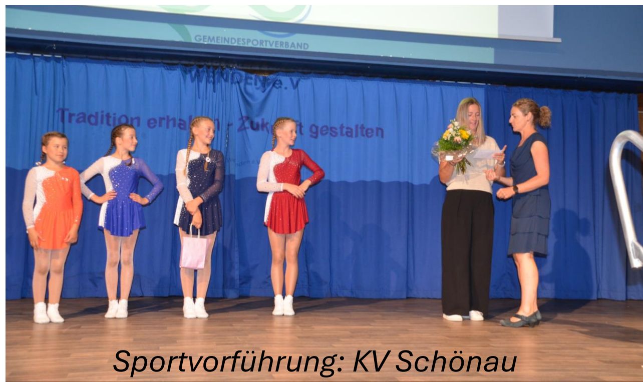
Sportvorführung: KV Schöna