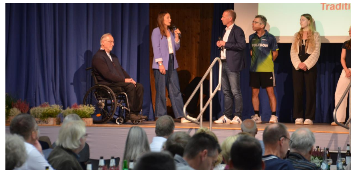
Kurz-Interviews mit erfolgreichen Individualsportlern der Gemeinde Wenden Moderation: Kunibert Rademacher und Markus Niklas