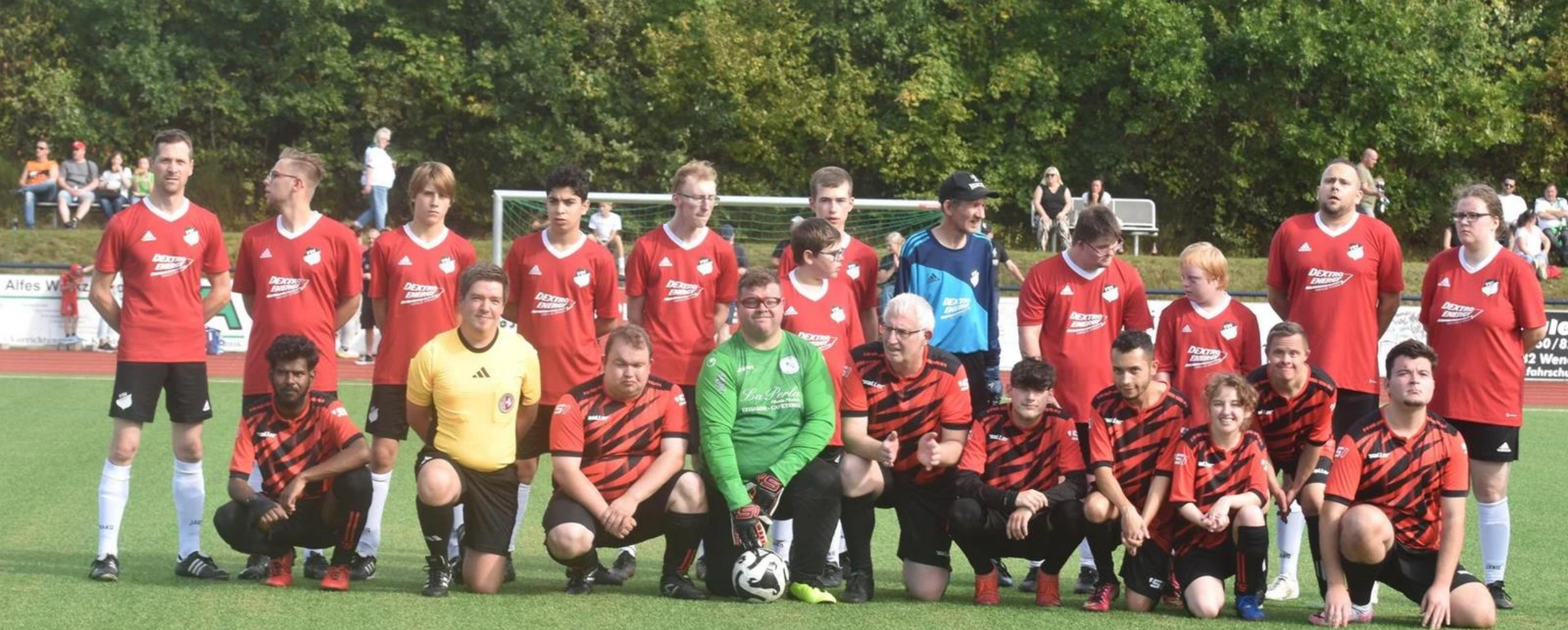
Inklusionsmannschaft FSV Gerlingen