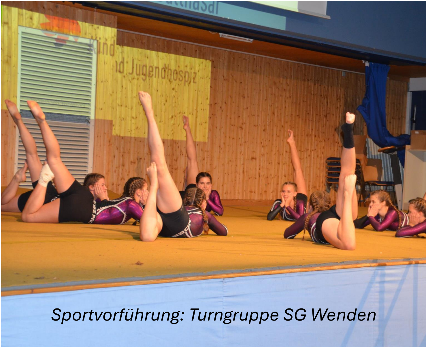
Sportvorführung: Turngruppe SG Wenden