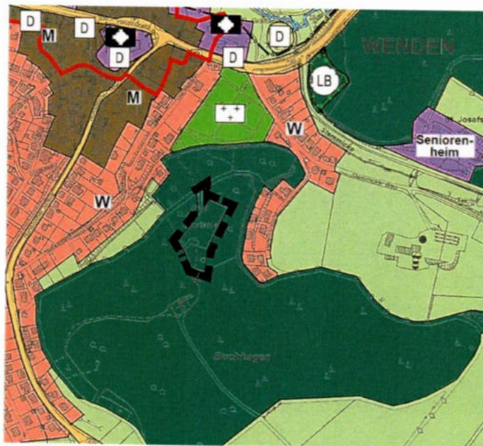
Abbildung 1: Lage und Geltungsbereich der 3. Flächennutzungsplanänderung Mountainbike Anlage Wenden.

Der Geltungsbereich umfasst folgende Flächen in der Gemarkung Wenden, Flur 26, Flurstücke 332 und 501 tlw. mit insgesamt ca. 0,53 ha Größe. Lage und Abgrenzung des Geltungsbereichs sind dem nachfolgenden Kartenausschnitt zu entnehmen.