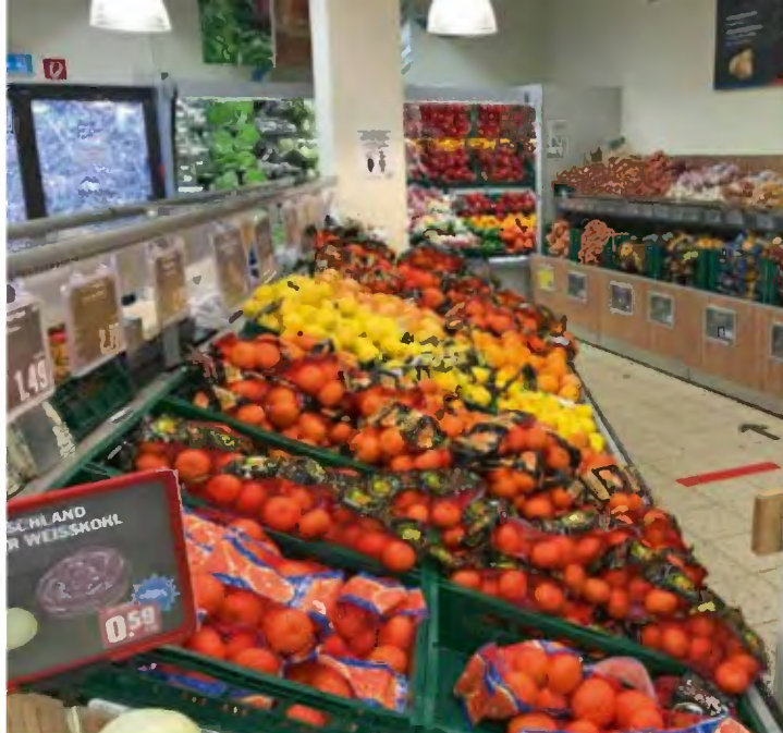
Zum Foto: Der HIT hat aufgerüstet. Mehr Frische geht kaum!

Ebenfalls ganz neu in Wenden: Gemeinsam mit dem Farmingnetzwerk Infarm baut HIT ab sofort Kräuter direkt im Markt an. Kunden können den Pflanzen beim Wachsen zusehen – denn das Kräuter-Gewächshaus befindet sich in der Obst- und Gemüseabteilung. Die Kräuter behalten nach der Ernte ihre Wurzeln und bleiben so länger frisch. Der Anbau direkt im Markt bedeutet 90 Prozent weniger Transportwege, das Anbausystem kommt ohne Erde aus und spart 95 Prozent Wasser im Vergleich zum herkömmlichen Anbau. Außerdem wird auf den Einsatz von chemischen Pestiziden komplett verzichtet, auf Dünger bis zu 75 Prozent. Die Kräuter wachsen in einer kontrollierten Umgebung unter idealen Bedingungen. Frischer geht es wirklich nicht.