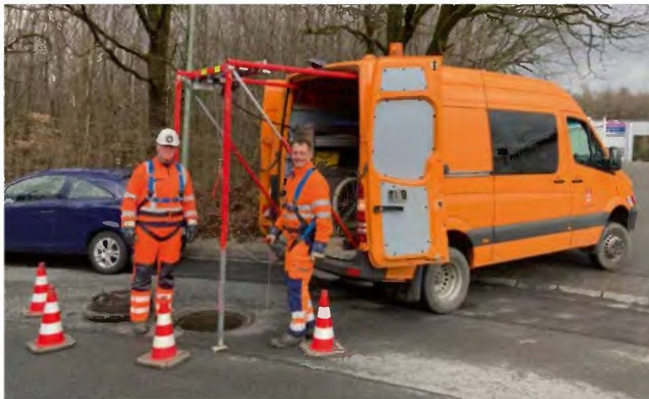
Zum Foto: Dem Bauhof obliegt maßgeblich die Unterhaltung und Spülung des Kanalnetzes. Wir sehen v.l.n.r. Wolfgang Dornseifer und Michael Hochhard.

Neben der Planung, Ausschreibung und Überwachung der Arbeiten aus dem ABK durch die Mitarbeiter im Rathaus, werden viele Tätigkeiten auch durch das eigene Bauhofpersonal umgesetzt. Durch regelmäßige Kontrollen und Reparaturarbeiten an Schächten, Kanälen, Sonderbauwerken sowie der Betreuung der jährlichen Kanalreinigungsarbeiten