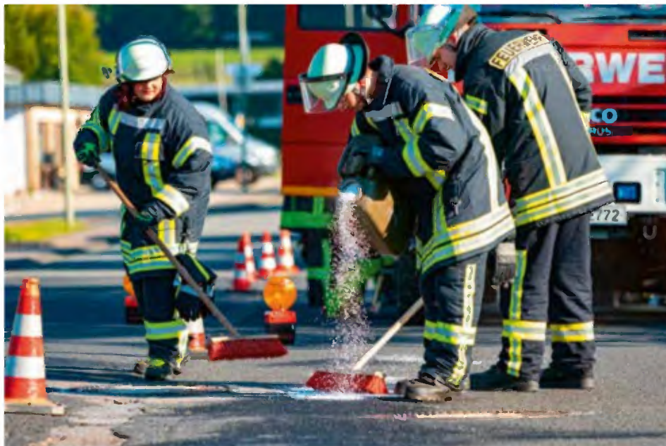
Zum Foto: Der Feuerwehreinsatz geht über das Löschen eines Brandes weit hinaus.

Die aus rund 150 Stunden bestehende Grundausbildung muss jeder bei uns absolvieren, der aktiv in der Einsatzabteilung tätig werden möchte. Ist die Grundausbildung jedoch abgeschlossen, bieten wir viele Möglichkeiten der Aus- und Fortbildung. Als Mitglied einer Freiwilligen Feuerwehr kannst du noch viele