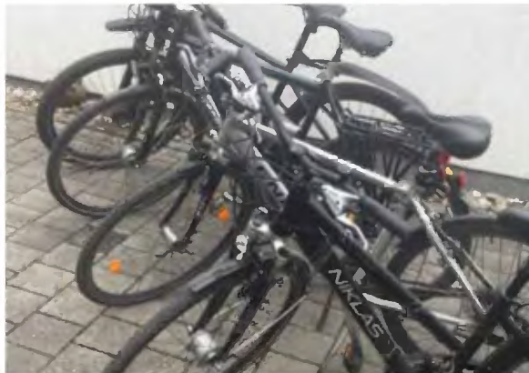
Zum Foto: Radfahrer haben auf kombinierten Rad- und Gehwegen keinen Vorrang. Sie müssen vorsichtig agieren und Rücksicht nehmen auf die Fußgänger(innen).