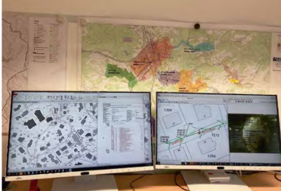
Zum Foto: Der Arbeitsplatz von Dipl.-Ing. Markus Großhaus ist natürlich vollumfänglich digitalisiert.

Gemeindeverwaltung – das ist weit aus mehr als „Knöllchen verteilen“ und „Pässe ausstellen“. Das Wohl der