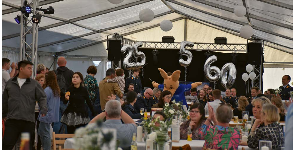
Zum Foto: „Gummi“ kann nicht nur Handball! Beim Dirigieren des Musikvereins Gerlingen zeigte er sein musikalisches Talent.