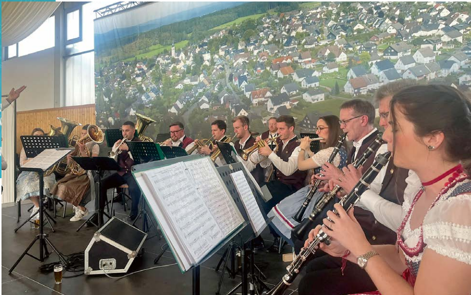
Zum Foto: OKM, die „Original Knippchen Musikanten“ aus Heid kamen mit ihrem Egerlandsound sehr ausgewogen daher.