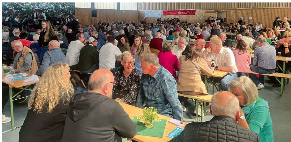
Zum Foto: Gut besucht war die Veranstaltung zu „Wendisch Brass“. Die Zeichen stehen auf Wiederholung.

Ein Wiedersehen soll es bereits im nächsten Jahr geben. Die Begeisterung des Publikums war groß. Das Interesse an der Egerländer Blasmusik hat eine Renaissance erfahren. In Memoriam Ernst Mosch könnte sich das „Kleine Woodstock der Blasmusik“ im Wendischen etablieren. Freuen wir uns darauf!