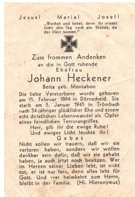
Zum Foto: Berta Heckener (geb. Montabon) kam beim Bombenangriff auf Trömbach am 5. Januar ums Leben