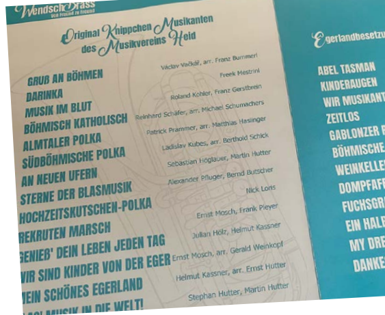
Zum Foto: Ein Blick ins Programm versprach einen bunten und vielfältigen Abend.