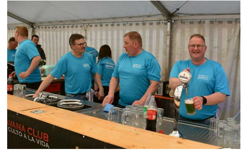
Zum Foto: Das Zapfteam hatte alle Hände voll zu tun.