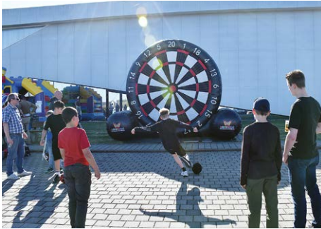
Zum Foto: Beim Fußball-Dart konnten sich die jüngeren Gäste ordentlich auspowern.