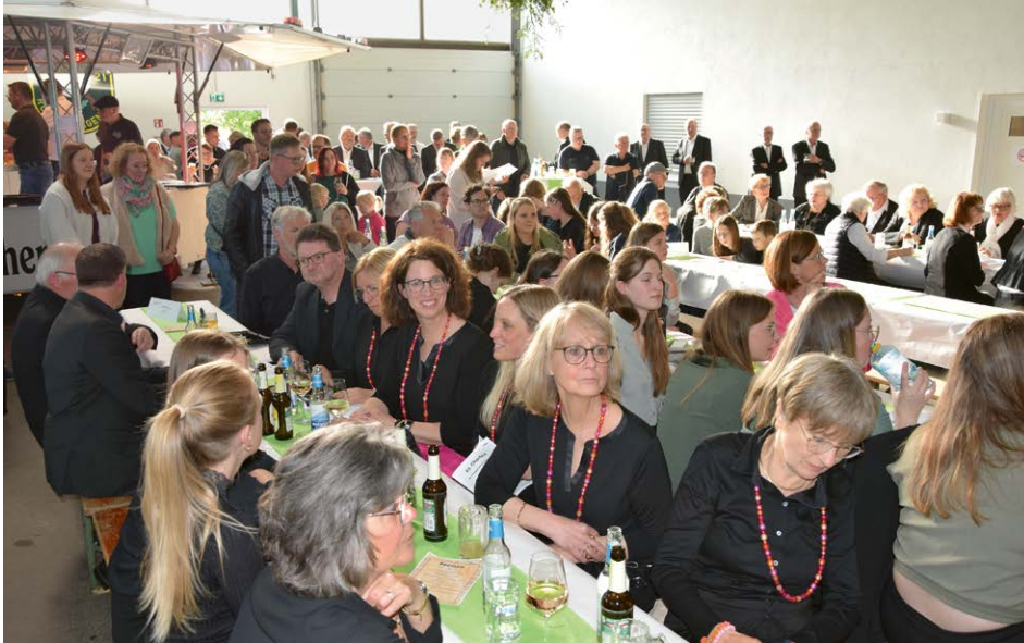
Zum Foto: Unterschiedliche Besetzungen mit einem hohen Anteil an Frauen bereichern inzwischen das Gemeindechorfest.