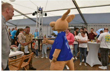
Zum Foto: „Gummi“, das Maskottchen des VfL Gummersbach, war der Star gerade bei den jüngeren Gästen.