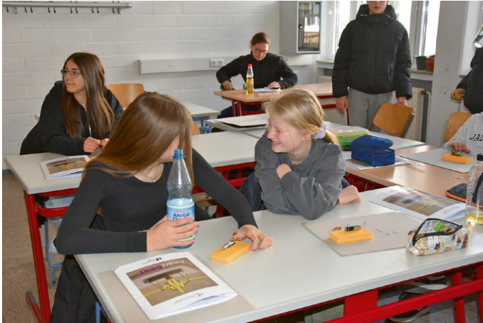
Zum Foto: So macht Schule Spaß!

Die Besonderheit des Projekts liegt vor allem in der Intensität, was Zeit und Betreuung betrifft: Pro Gruppe betreuen drei Studierende der naturwissenschaftlich-technischen Fakultät das vorwiegend selbstständige Arbeiten der Schülerinnen und Schüler. Eine für beide Seiten vorteilhafte Zusammenarbeit: Die Kinder können ihren Forschergeist in praktische Ergebnisse umsetzen und die Studierenden der Naturwissenschaften können sich im Umgang mit den Jugendlichen üben und ihre Begeisterung für die MINT-Fächer weitertragen.