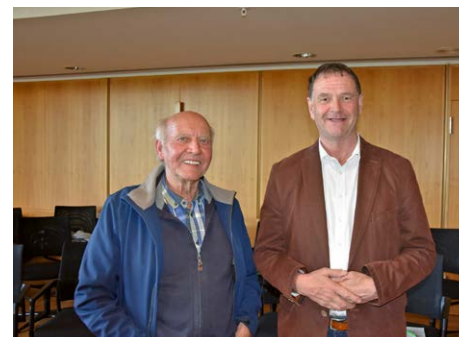
Zu den Fotos: Nach der Gesprächsrunde nutzten zahlreiche Besucher noch die Gelegenheit, sich über diesen bewegenden Abend auszutauschen.