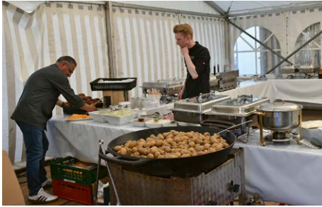
Zum Foto: Das Catering-Team vom Partyservice Schumacher hatte alle Hände voll zu tun.