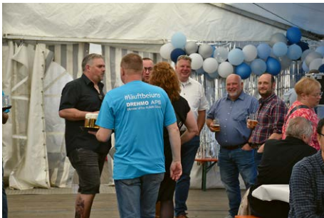
Zum Foto: „Läuft bei uns“ – Dank der Unterstützung zahlreicher Vereine und Unternehmen wurde der Tag zu einem unvergesslichen Erlebnis für die Gäste.

der Poke-Bowl-Station sowie bei verschiedenen Burger-Variationen, vegetarischen Speisen und leckeren Nudelgerichten blieb kein Wunsch offen.